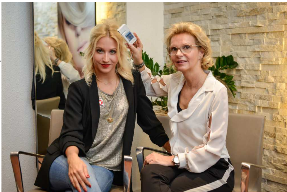
Strassl Exklusiv Beauty 01